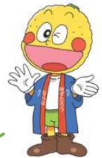
檜葉町マスコットキャラクター ゆず太郎

移住に関する相談は、 ならはスタートアップ・ プレイスCODOU/コドウ でおこなっています。 ご連絡お待ちしております!