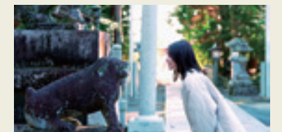
②ならはめぐり～秋冬Ver.～